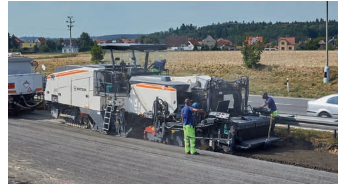
W 240 CR 型冷再生机工作宽度 2.35 m，配摊铺熨平板。

W 380 CR 型冷再生机能够以整个工作宽度一次性再生一个车道，不仅机器能够以后出料模式施工，而且施工日产量也大大提高。摊铺机料斗具有超大储料能力。通过摆动式输料皮带可将剩余材料输送到卡车上。位于机器前方的材料导板系统用于收集侧方预铣刨后的材料，从而再生出超过机器固定宽度的路面。