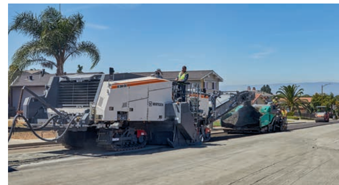
W 380 CR 型冷再生机工作宽度 3.8 m，配输料皮带，并与摊铺机共同施工。