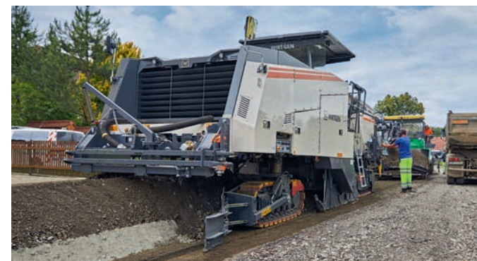
在侧方预铣刨和摊铺机的配合下，W 240 CR 型冷再生机能够以整个工作宽度进行再生施工。