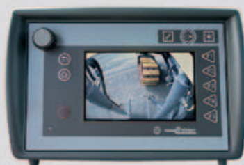
Telecamera posteriore destra