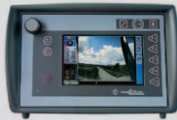
Telecamera all'estremità del nastro convogliatore