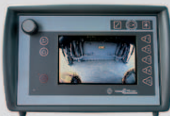
Telecamera posteriore centrale