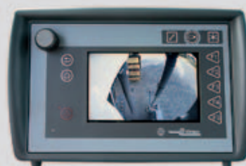
Telecamera posteriore sinistra