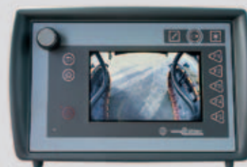
Telecamera anteriore centrale